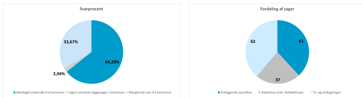
Figur 1: svarprocent og fordeling af sager

Vurderingen vedrørende opfyldelse af dokumentationskrav er foretaget ved systematisk gennemgang af byggesagerne og på baggrund af Rambølls omfattende erfaring med byggesager i kraft af bygherrerådgivning. For at sikre systematik har sagsgennemgangen baseret sig på klare kriterier og fuld og tydelig opfyldelse af dokumentationskrav efter BR15 i sagerne. Hermed reduceres behovet for subjektivt skøn og vurdering. Som et eksempel skal dokumentation for "Spær leveret fra spærfabrik"